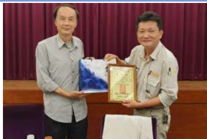
2024 顯為營造廠股份有限公司