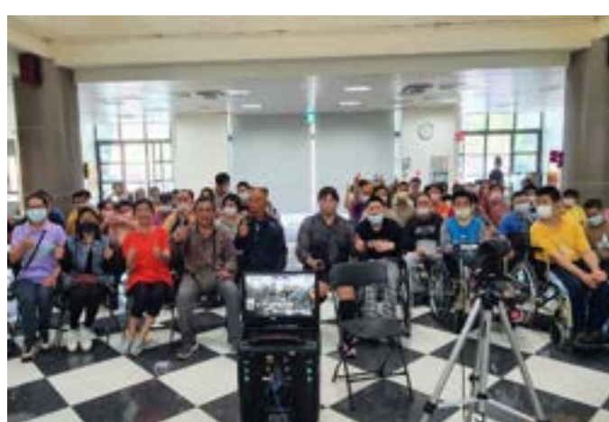
2024 土地銀行義賣-凱基人壽金揚通訊處