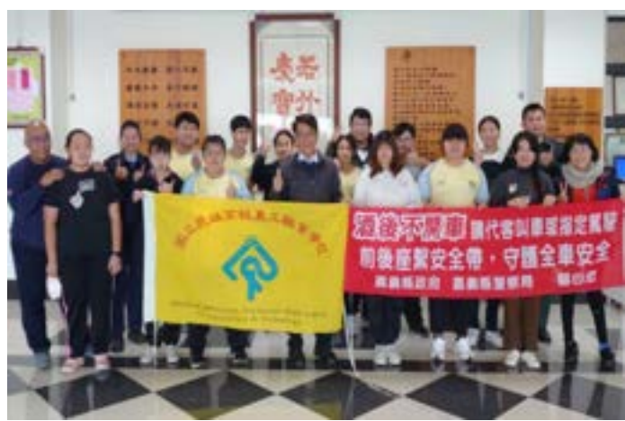
2024 民雄農工同樂送暖