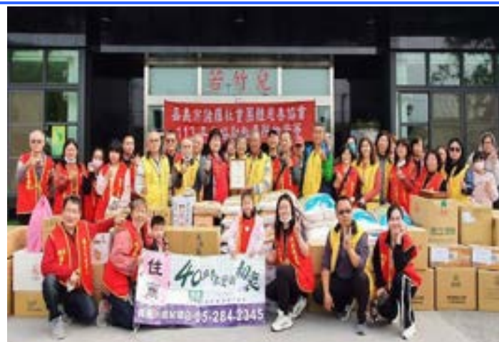
2024 嘉義市諸羅社會團體慈善協會