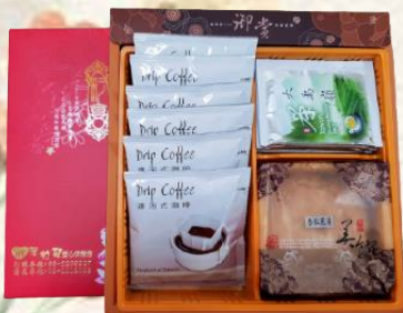
茶 & 咖啡禮盒