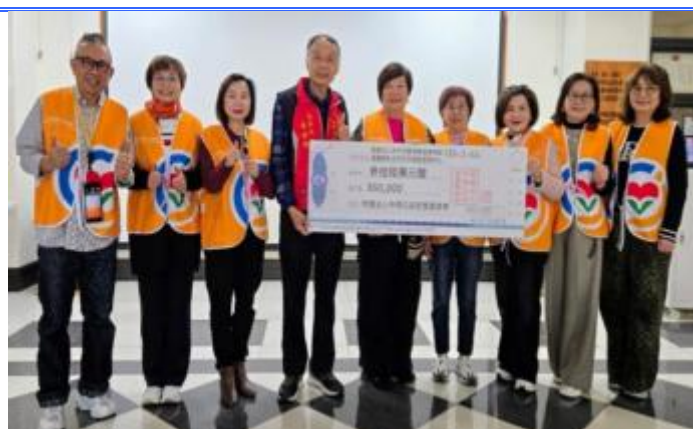
2026 中傑公益慈善基金會