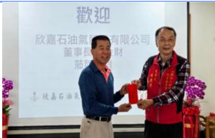
2026 欣嘉石油氣股份有限公司