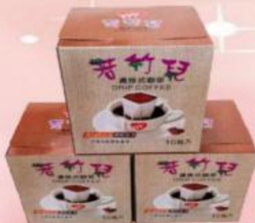
濾泡式咖啡 10入盒裝