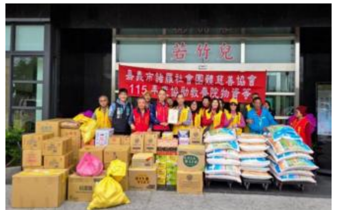
2026 嘉市諸羅社會團體