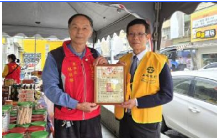
2026 土地銀行義賣活動