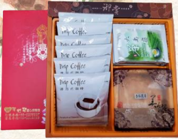
茶 & 咖啡禮盒